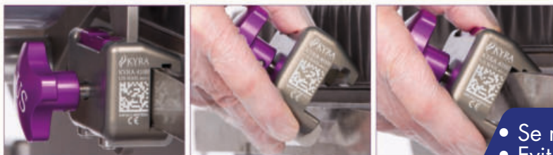
KYRA4200 Abrazadera Secure-Release™ UE)