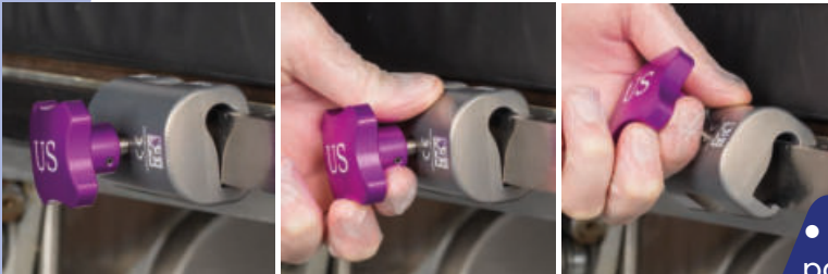
KYRA4610 Abrazadera de riel de hoja UE)UE)